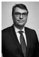
M. LE BÂTONNIER FRÉDÉRIC SICARD

3 rue Léon Bonnat 75016 PARIS T. 01 43 59 11 11 F. 01 43 59 22 22 sicard@lagaranderie.fr